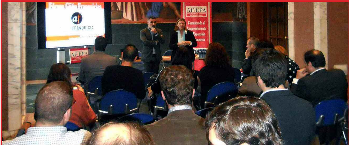
Imagen de la inauguración de AsturFranquicia 2019

El objetivo final de las instituciones y asociaciones participantes es dar a conocer/informar directamente a los futuros emprendedores en el sistema comercial de la franquicia de la existencia de los distintos instrumentos de apoyo a la iniciativa empresarial existentes en el Principado de Asturias.