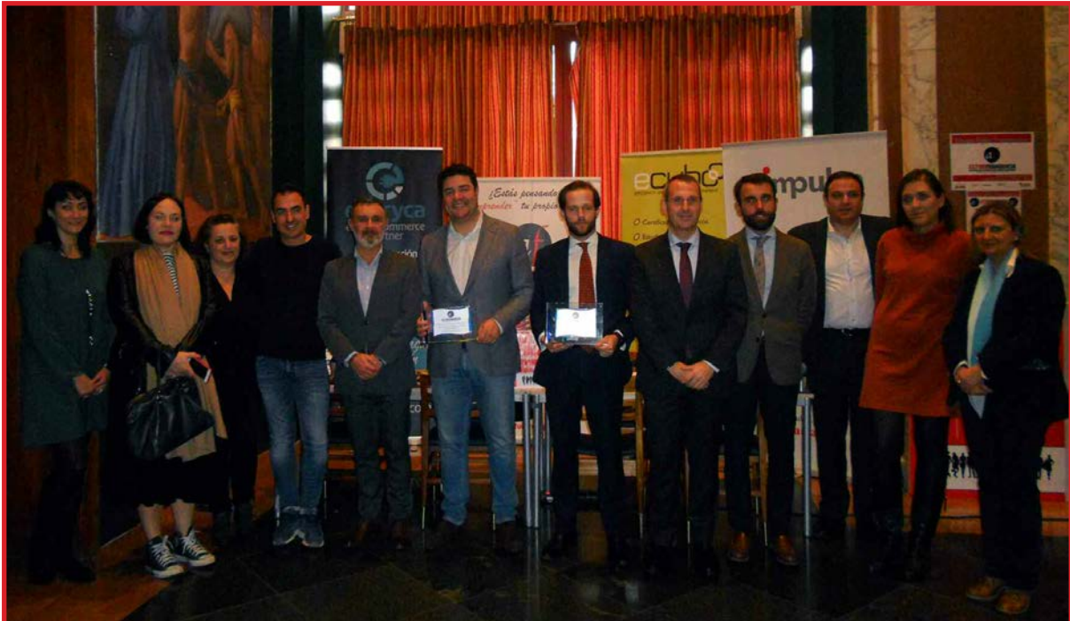
Imagen de la entrega de Premios AsturFranquicia 2019

AsturFranquicia , Feria de la Franquicia en Asturias, celebrará el día 26 de noviembre de 2020 en Gijón su IX Edición. Este evento es el encuentro profesional de referencia en Asturias entre centrales franquiciadoras, consultoras especializadas en franquicia y emprendedores e inversores interesados en adherirse al Sistema Comercial de Franquicia.